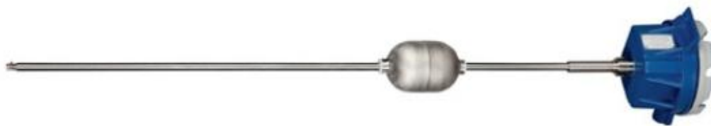
Фотография места пломбировки уровнемера